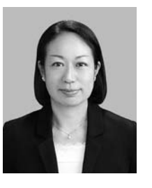
石黒久仁子教授のポートレート写真。

ジェンダー平等の推進は、社会の持続的な発展にとって不可欠である。石黒教授は、ジェンダー平等の推進に向けた取り組みについて、具体的な提言を行っている。